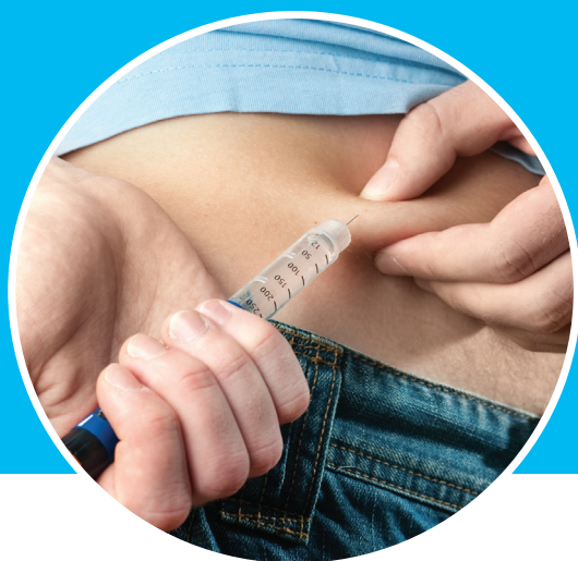
Slika 1. Način davanja inzulina i mjesta za davanje inzulina

Količina inzulina se određuje okretanjem točkića kojim se odredi broj jedinica inzulina. Djeca se liječe višekratnim davanjem inzulina tokom dana /4x dnevno/ što će zahtijevati i davanje inzulina u školi.