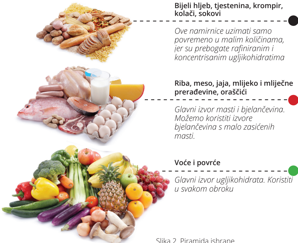
Slika 2. Piramida ishrane